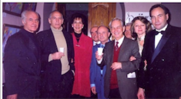
На снимке (слева направо): композитор народный артист СССР, автор знаменитого вальса из кинофильма «Мой ласковый и нежный зверь» Евгений Дога, народный артист России Василий Лановой, виолончелистка Галина Ежова, народный артист СССР Юрий Кукорев, исполнивший роль Ленина в кино и Малом театре; поэт Влад Красноярский